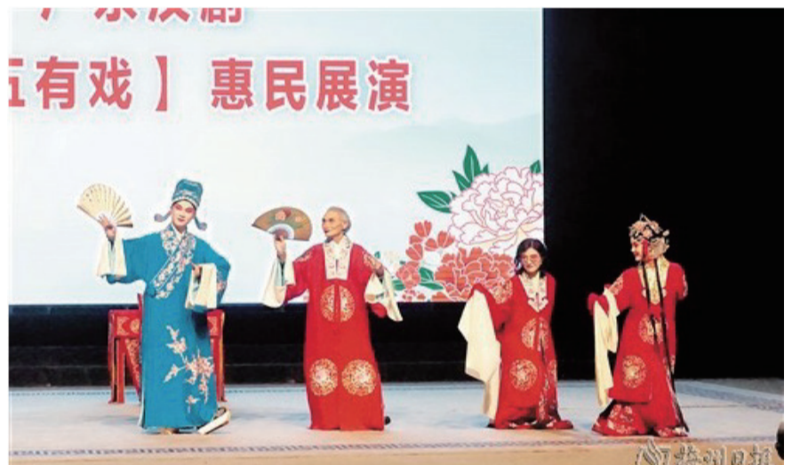
部分僑胞體驗了廣東漢劇扮相,沉浸式體驗戲曲文化的藝術魅力。

廣東漢劇傳承研究院黨委書記王育平表示,廣東漢劇傳承研究院擬在明年以組團方式赴毛裏求斯進行交流演出,並在現有推廣中心工作開展的基礎上進行實地考察,努力拓展與毛裏求斯的文化交流。同時,爭取在馬來西亞、新加坡、印度尼西亞等國家設